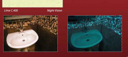
Таблица расхода затирочной смеси LITOKROM STARLIKE